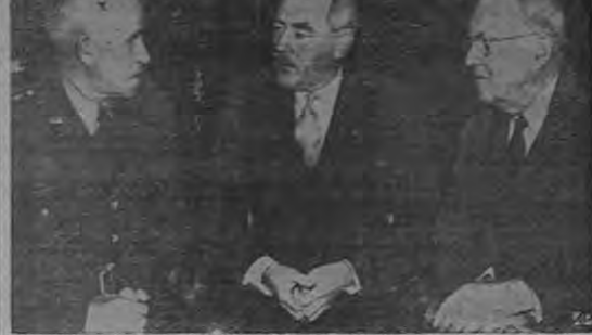
El General Omar Bradley, presidente de los Jefes del Estado Mayor conjunto; el Secretario de Estado Dean Acheson, y John Foster Dulles (agente de la derecha) comparecen ante el Comité de Relaciones Exteriores del Senado el 21 de Enero en Washington...