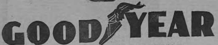
SURE-GRIP para tracción máxima en caminos húmedos

LOS PRODUCTOS GOODYEAR se fabrican en Argentina, Australia, Brasil, Canadá, Colombia, Cuba, India, Indonesia, Inglaterra, Irlanda, Luxemburgo, México, Nueva Zelanda, Perú, Sud Africa, Suecia y Estados Unidos. Suavantes, Distribuidores y Vendedores por todo el mundo.