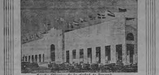
Estadío Olímpico de la ciudad de Panamá