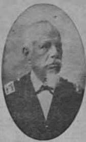
DON ELOY ALFARO