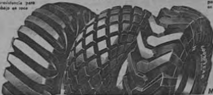
ALL-WEATHER EARTH MOVER para vehículos remolcados o de tracción general